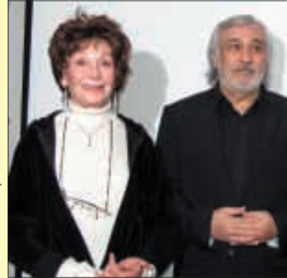
Soldan sağa: Prof. Yıldız Kenter, Müjdat Komitesi Başkanı Prof. Talat Halman ile